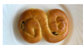
Hemköp 10 kr

Skulle kunna vara gjord på dagis. Totalt smaklös! Är den verkligen färdiggräddad?