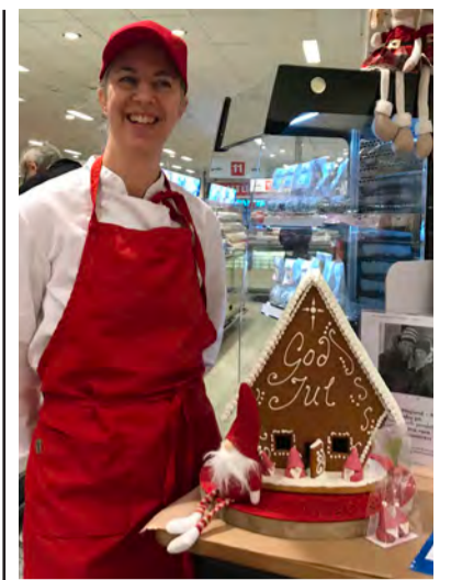
– Jag tänkte att det skulle vara ett pampigare pepparkakshus än det man gör själv hemma.