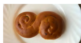
Pressbyrån 19 kr

Julen har anlänt med all dess mat och bakverk. Lussebullen, en favorit hos många, finns att köpa i nästan varje matbutik, kiosk och café. De kommer i flera olika former, smaker och utseenden. iFokus-redaktionen satte sig ner för att testa både lyx- och budgetbullar. Men vilken är egentligen bästa lussebulle i Jakobsberg?