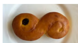
Coop 11 kr

Serfejkochglansig ut! Smakar alldeles för lite saffran. Tung och brödig utan fluff!