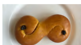
Sans Rival 25 kr

Stor, rund, varm och inbjudande. Smakar lite deg och alldeles för mycket ägg men mjuk på ett bra sätt.