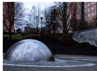
På grund av upplevd otrygghet har Söderhöjden fått väktare på fredagar och lördagar.

Den upplevda otryggheten hos invånarna i Järfälla ligger över snittet i länet. I Nationella trygghetsundersökningen 47 procent av Järfällaborna att de är oroliga för brottslighet i samhället. Genomsnittet för Stockholms län ligger på 40 procent. Även upplevd otrygghet vid utevistelse på kvällen snittar högre i kommunen, med 40 procent jämfört med länets 28 procent.