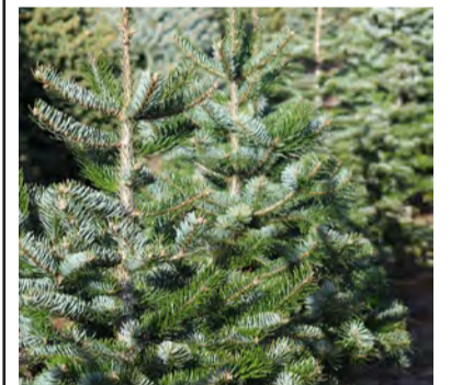
2018 samlade kommunen in över 3000 granar.

moa.nielsen.edstam@jakobsbergshogskola.se