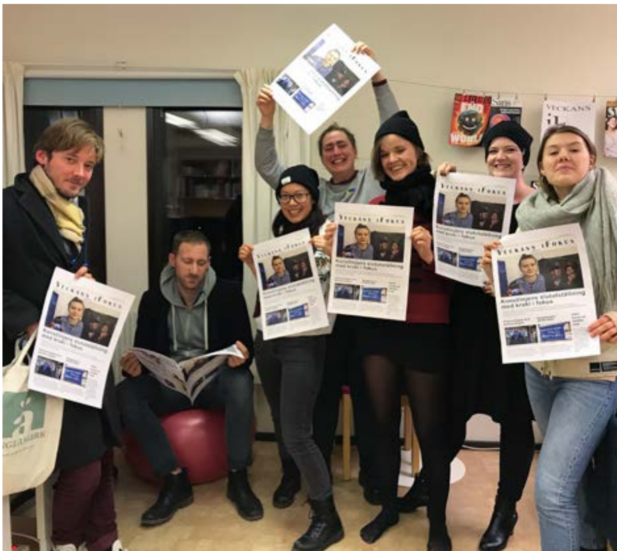
Journalistkursen producerar lakaltidningen Ifokus.

En genomarbetad utställning i december avslutande terminens intensiva arbete. Åtta av tolv deltagare gick vidare till vårens projekttermin.