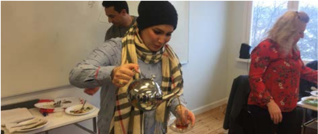
Deltagare på allmän kurs bjuder på te.

passade bra då det var riksdagsval. Uppsatsskri- vandet hade som syfte att förbereda inför högre studier med tydliga deadlines, opponeringar och en uppsatssmall. På våren fick alla i AK3 pröva att göra ett tidigare högskoleprov.