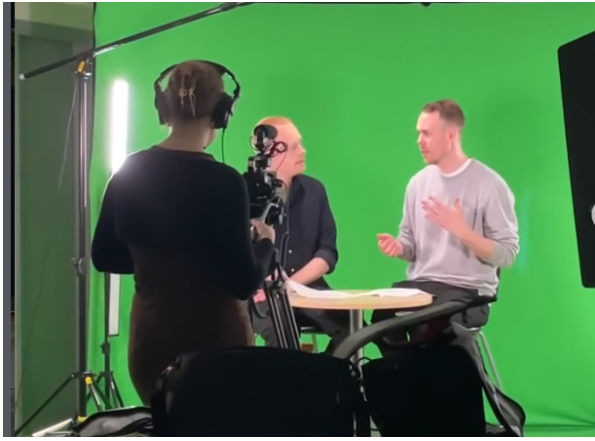
Journalistklassen i TV-studion.