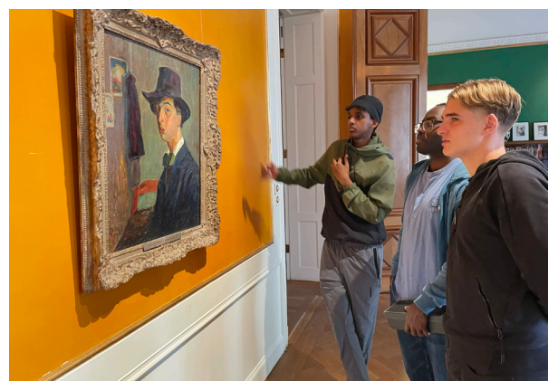
AK på Waldemarsudde.