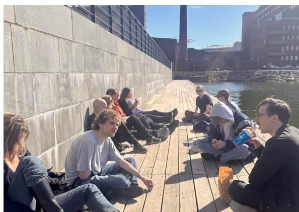
Kul med utflykt.