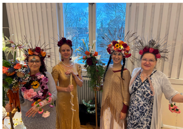
Utställning av Floristkursen.