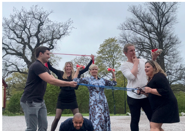
Hälsoutvecklarna firar 40 år