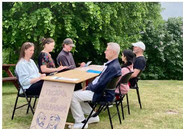
Konstövning på JF-dagen.