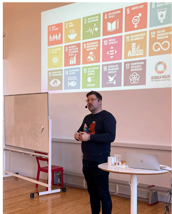
Föreläsning om Agenda 2030.

Astrid Lindgren - författarskap, biografi och personligt engagemang: Alla fick varsin bok, Mio min Mio. Läsningen blev utgångspunkt för litterär analys och personliga reflektioner, samt eget skrivande. Vi gjorde studiebesök på Waldemarsudde och deltog där en i workshop om bildanalys.