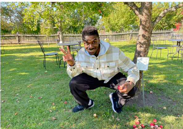
Fallfrukt, gratis mat.