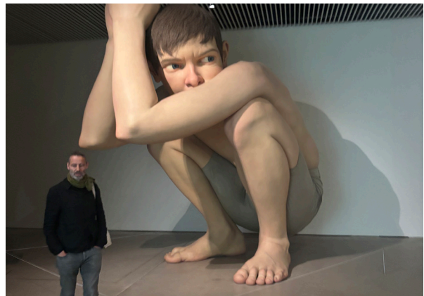
Konstbesök när personalen var i Danmark.