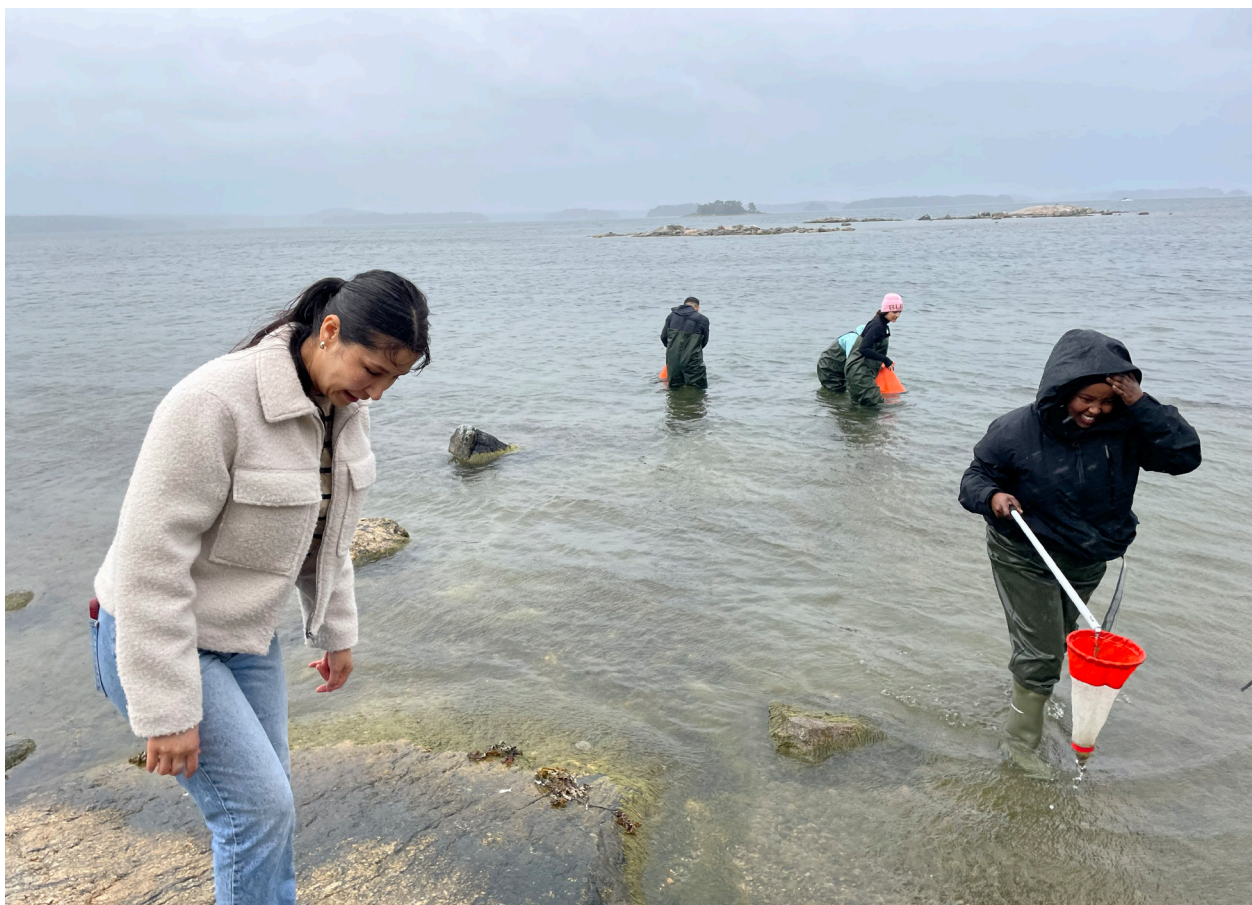
Laboration på Gålö.

Klimat/Agenda 2030: Naturbas var på Gålö under hösten 2025. De undersökte och artbestämde för att sedan skriva en laborationsrapport. Allt kopplades till diskussioner kring Östersjön, dess mående