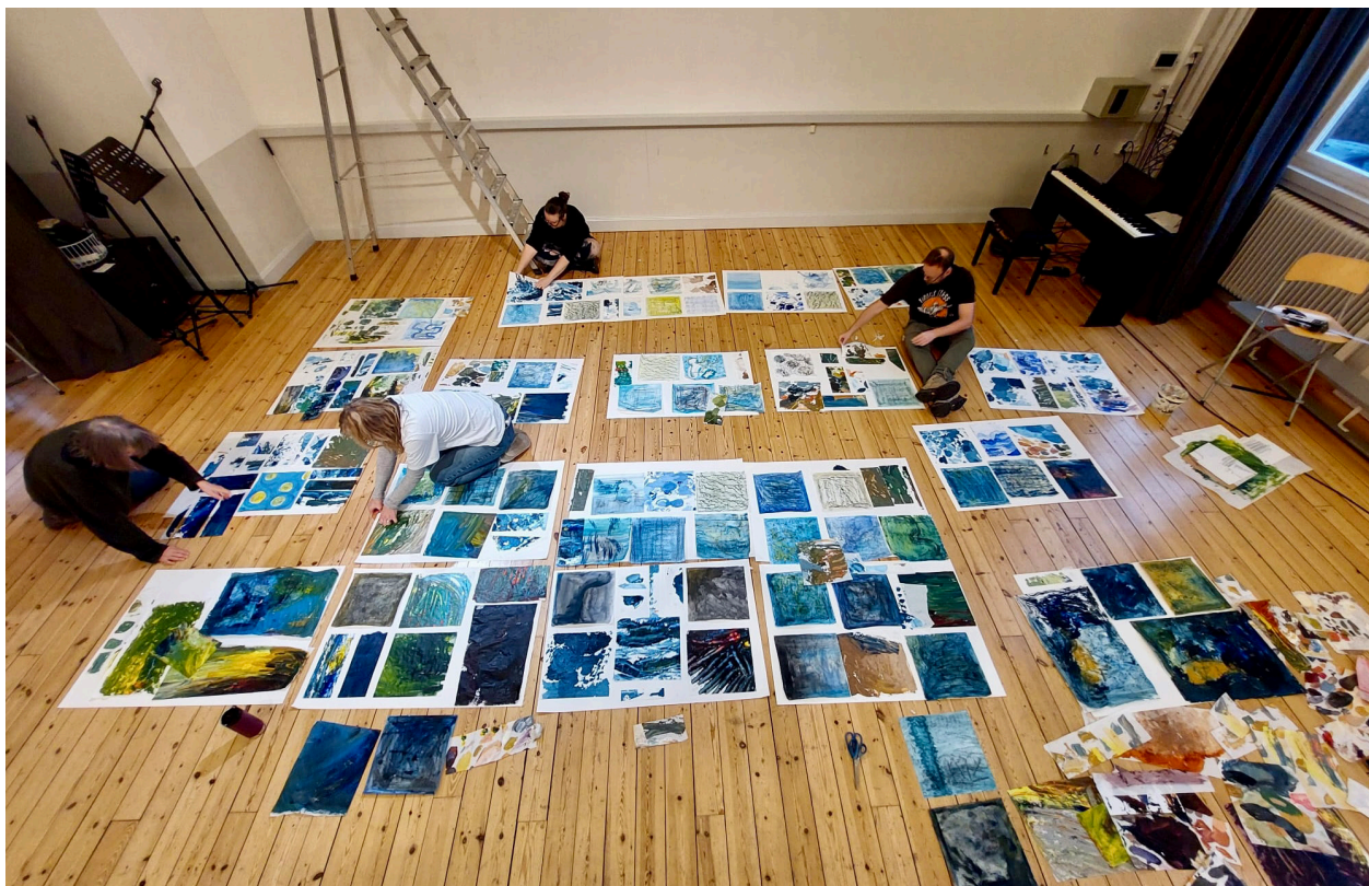
Bygge av det gemensama konstverket Djupet av konstklassen till utställningen i december.

Under 2025 har det konstnärliga arbetet fortsatt med stor energi. Tecknande, måleri och skapande har varit centrala delar av kursens innehåll och har erbjudit deltagarna möjlighet att utforska både grundläggande och mer experimentella uttryck.