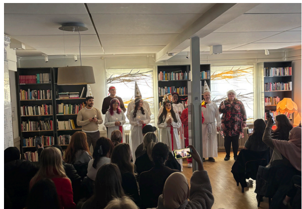
Luciatåg i biblioteket.