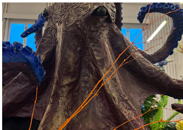
Bläckfisk i floristernas utställning.