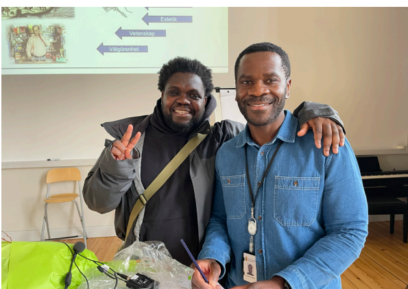
Kitimbwa Sabuni föreläste om kolonialism och rasism.