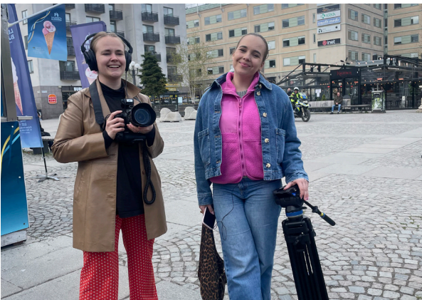
Journalisterna livesände från Folksalongen