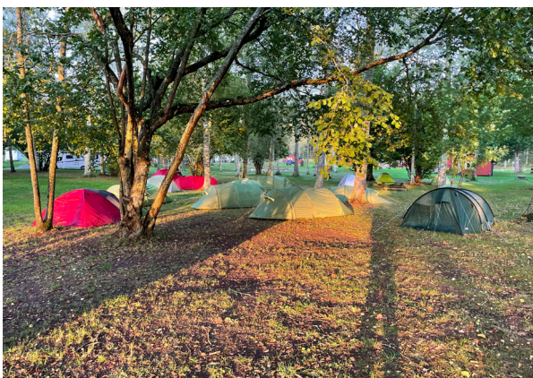
Övernattning i tält på Gålö för naturbas.