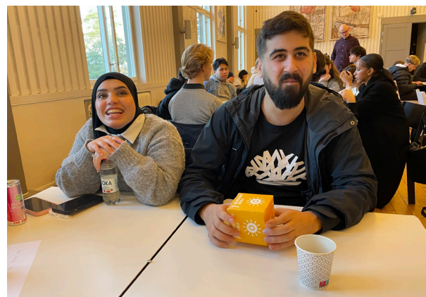
Nyfikna deltagare på Agenda 2030-föreläsningen.