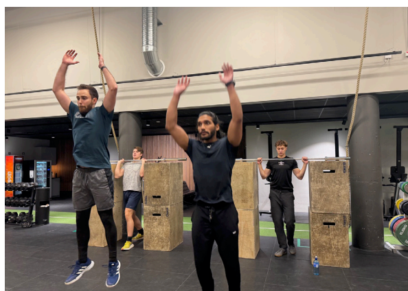
PT-deltagare tränar explosivitet.